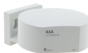
TS-ACC-FE Ref.: 92683

Absorption de courant: 10 mA Température ambiante: +5 °C à +35 °C Boîtier: POM, PC