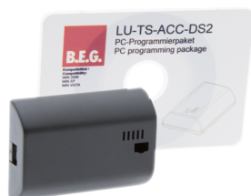
TS-ACC-DS2 Ref.: 92685

Tension: 230 V AC 50 / 60 Hz Absorption de courant: 10 mA Température ambiante: +5 °C à +35 °C