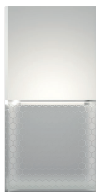
93132 White Bright