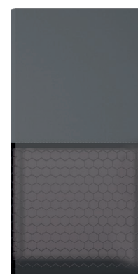
93134 Anthracite Dark