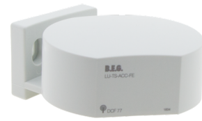
TS-ACC-FE Art.No: 92683

Stromaufnahme: 10 mA Umgebungstemperatur: +5 °C bis +35 °C Gehäuse: POM, PC