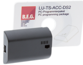
TS-ACC-DS2 Art.No: 92685

Spannung: 230 V AC 50 / 60 Hz Stromaufnahme: 10 mA Umgebungstemperatur: +5 °C bis +35 °C