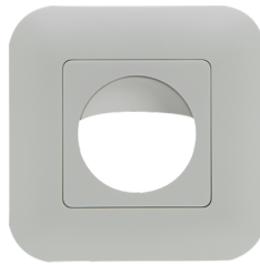
Rahmen IP20 Indoor 180 Art.No: 92630

Spannung: 230 V AC +/- 10% 50 Hz Abmessungen: 86 x 18 x 66 mm (1 TE) Typische Leistungsaufnahme: < 0.75 W