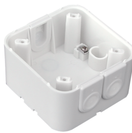
Aufputzdose Indoor 180 Art.No: 92141

Abmessungen: 92633= 86 x 86 mm Schutzart/-klasse: 92633= IP20 Gehäuse: Polycarbonat, UV-beständig