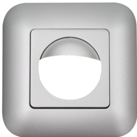
Rahmen IP20 Indoor 180 Art.No: 92633

Abmessungen: 92632= 86 x 86 mm Schutzart/-klasse: 92632= IP20 Gehäuse: Polycarbonat, UV-beständig