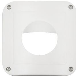
Rahmen IP54 Indoor 180 Art.No: 92139

Abmessungen: 92634= 86 x 86 mm Schutzart/-klasse: 92634= IP20 Gehäuse: Polycarbonat, UV-beständig