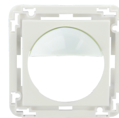
Zentralplatte Indoor 180 45x45 Art.No: 38947

Abmessungen: 88 x 88 x 42 mm Schutzart/-klasse: IP54 Stoßfestigkeitsgrad: IK05