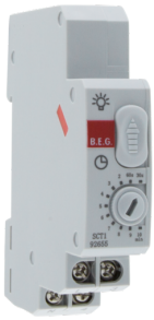
SCT1 Art.No: 92655

Spannung: 230 V AC +/- 10% 50 Hz Abmessungen: 86 x 18 x 66 mm (1 TE) Typische Leistungsaufnahme: < 0.75 W