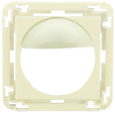
Zentralplatte Indoor 180 45x45 Art.No: 39076

Abmessungen: 45 x 45 mm Gehäuse: Polycarbonat, UV-beständig Farbe: perlweiß matt, ähnlich RAL1013