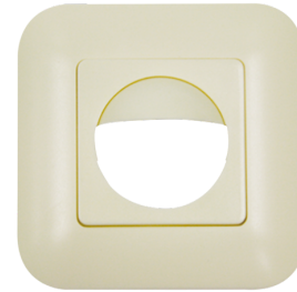
Rahmen IP20 Indoor 180 Art.No: 92632

Abmessungen: 92139= 87 x 87 mm Schutzart/-klasse: 92139= IP54 Gehäuse: Polycarbonat, UV-beständig