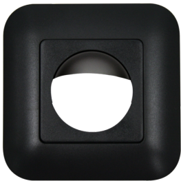
Rahmen IP20 Indoor 180 Art.No: 92634

Abmessungen: 92631= 86 x 86 mm Schutzart/-klasse: 92631= IP20 Gehäuse: Polycarbonat, UV-beständig