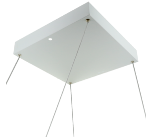
Pendelsatz PL1-LED Baldachin Art.No: 93090

Abmessungen: 295 x 295 x 50 mm, Stahlseillänge 1000 mm Gehäuse: Stahl Farbe: weiß