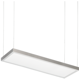
Pendelsatz PL1-LED Art.No: 93173

Abmessungen: 295 x 295 x 50 mm, Stahlseillänge 1000 mm Gehäuse: Stahl Farbe: weiß