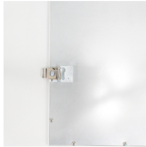
Einbaubügel-Set PL1-LED Art.No: 93117