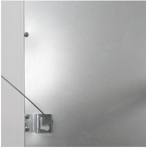
Fallsicherung PL1-LED Art.No: 93115