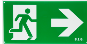
Piktogramm DT32-LED Pfeil nach rechts Art.No: 8858

Abmessungen: 170 x 330 x 1 mm Gehäuse: Kunststoff Farbe: grün