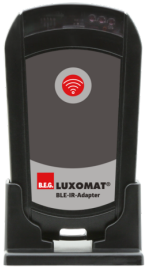
BLE-IR-Adapter Art.No: 93067

Abmessungen: 40 x 55 x 103 mm Farbe: schwarz Frequenz: 2.4 GHz ISM-Band, GFSK 0.2 dBm + 5.3 dBi = 5.5 dBm