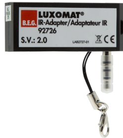
IR-Adapter für Smartphones Art.No: 92726

Abmessungen: 40 x 55 x 103 mm Farbe: schwarz Frequenz: 2.4 GHz ISM-Band, GFSK 0.2 dBm + 5.3 dBi = 5.5 dBm