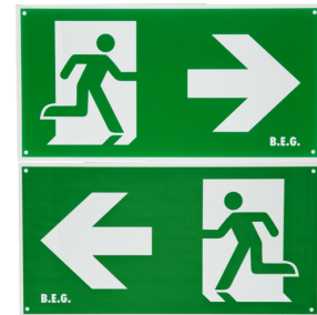
Piktogramm zweiseitig/rechts-links Art.No: 8860

Abmessungen: 47 x 19 x 10 mm Schutzart/-klasse: IP20 Umgebungstemperatur: -20 °C bis +40 °C