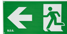
Piktogramm DT32-LED Pfeil nach links Art.No: 8859

Abmessungen: 170 x 330 x 1 mm Gehäuse: Kunststoff Farbe: grün