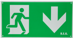
Piktogramm DT32-LED Pfeil nach unten Art.No: 8785

Abmessungen: 170 x 330 x 1 mm Gehäuse: Kunststoff Farbe: grün