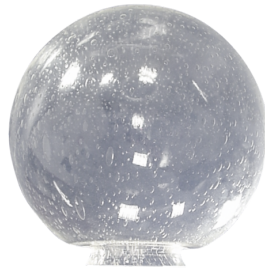
SG Oslo Art.No: 94101

Gehäuse: Polycarbonat, UV-beständig Farbe: weiß