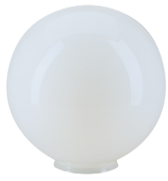
SG Wien Art.No: 94113

Abmessungen: (Halterand Ø 82 mm) Ø 200 x 210 mm Gehäuse: opal - glänzend Farbe: weiß