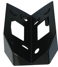
Ecksockel ALC-ES Art.No: 91325

Abmessungen: (Halterand Ø 82 mm) Ø 215 x 220 mm Gehäuse: Blasenglas - Kristall Farbe: transparent