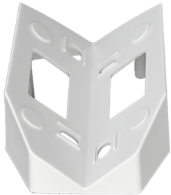
Ecksockel ALC-ES Art.No: 91305

Abmessungen: (Halterand Ø 82 mm) Ø 200 x 210 mm Gehäuse: opal - glänzend Farbe: weiß